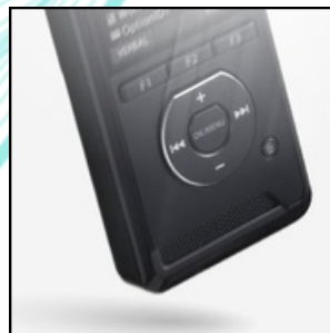
Robuste Konstruktion für den Diktieralltag